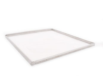
Virágporszárító polc: Rozsdamentes acél kerettel