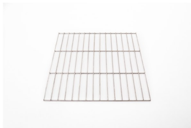
Mézmelegítő polc: Rozsdamentes acél